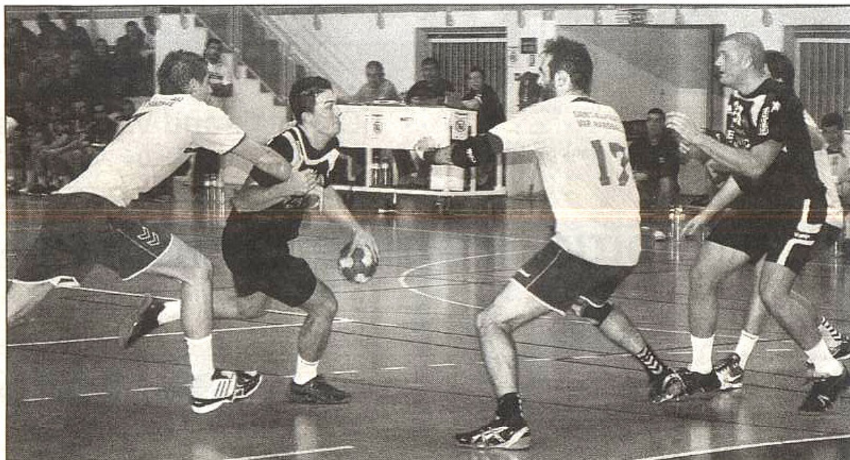
La Nationale 3 affronte aujourd'hui l'équipe de Bagnols-Marcoule (Gard).