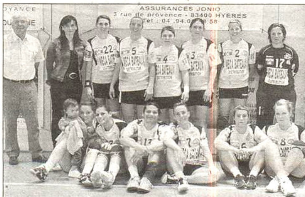
Samedi, les Crauroises se sont imposé 38 à 19.