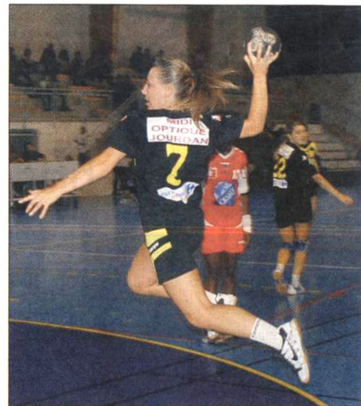
Les Crauroises ont arraché le nul en toute fin de match.