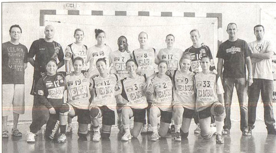
Les féminines de Nationale 2 se déplaceront à Voiron ce samedi.

L'équipe réserve féminine accueillera en ouverture de soirée à 18h30 La Seyne pour une rencontre qui s'annonce serrée puisque les deux équipes sont au coude à coude. Les Crauroises, huitièmes, tenteront de s'éloigner de la zone rouge face à des Seynoises qui ne l'ont emporté qu'à une seule reprise cette saison. Les féminines de Nationale 2 se déplaceront, quant à elles, à Voiron, en Isère. Face