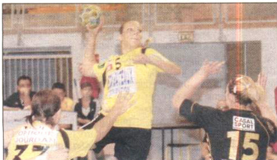
Les Crauroises à l'assaut du Pouzin ce soir.