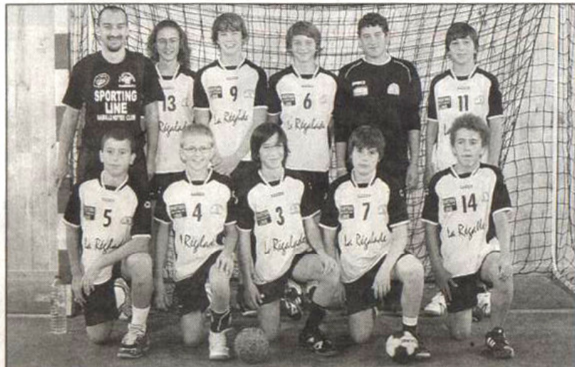
Les moins de 14 ans craurois ont décroché une belle seconde place.