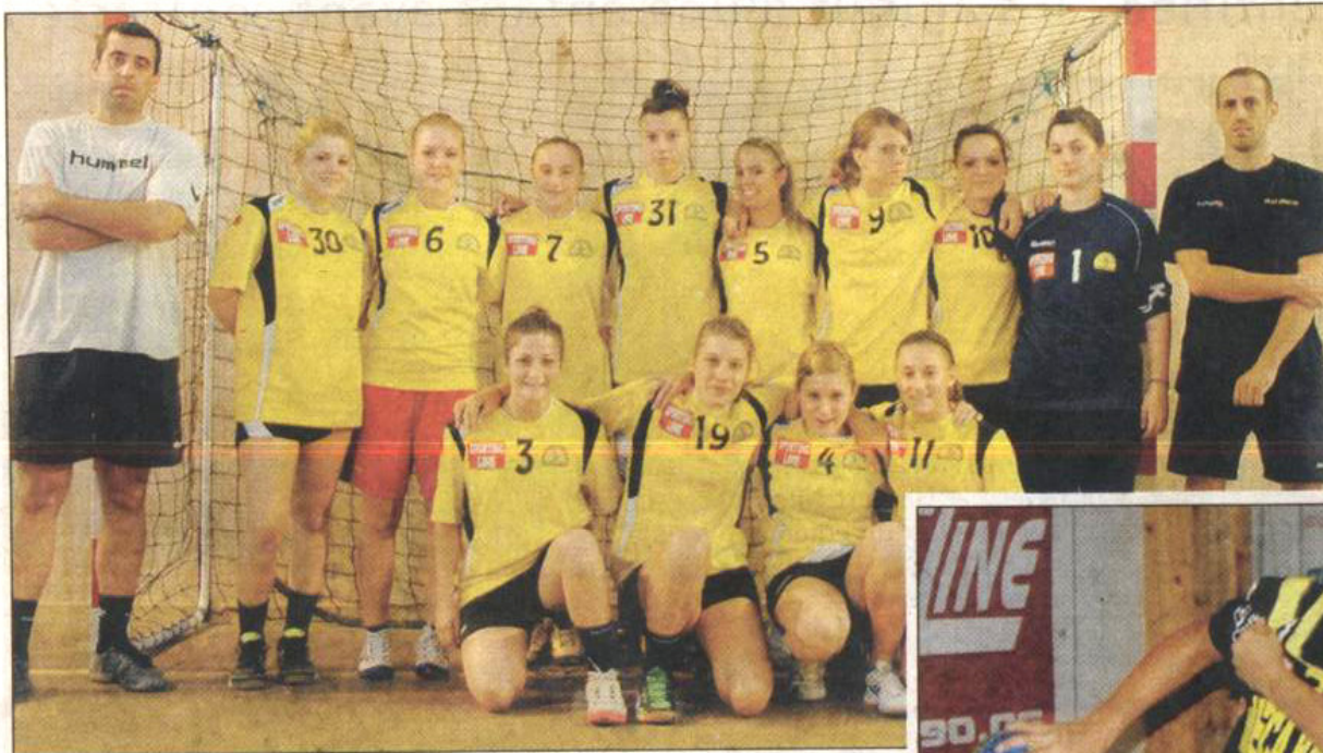
Les moins de 18 ans filles prennent la tête de leur championnat.