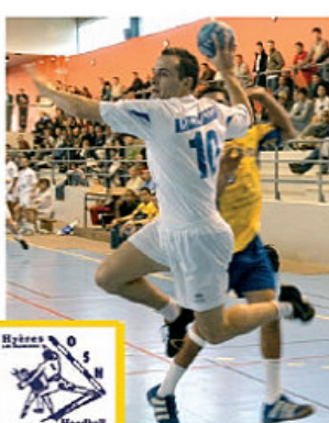
Hyères O S H Handball