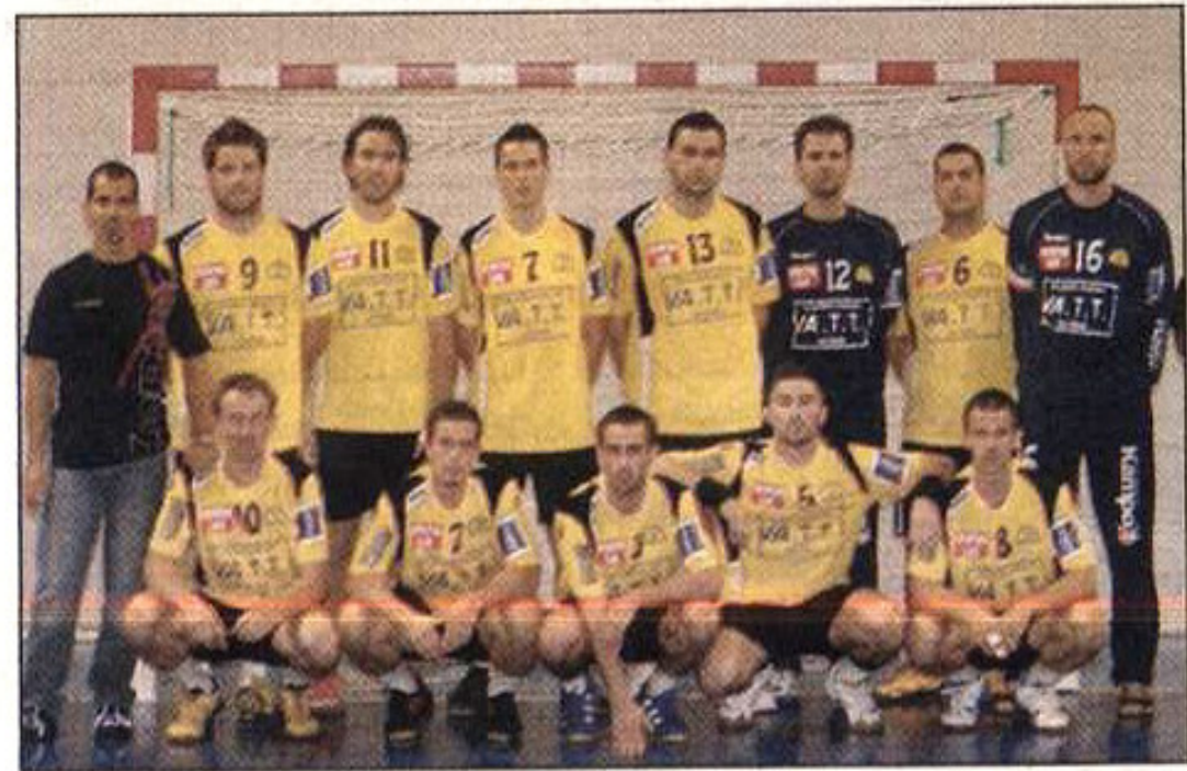
Les Craurois ont fait le métier ce week-end face à Grasse.