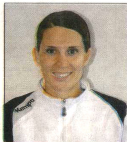
Pour la capitaine de l'US La Crau, la priorité est de « sortir de cette spirale de défaites devant notre public ».

de 16 ans et des moins de 18 ans. » Les résolutions pour 2010 ? « Toutes les joueuses sont motivées pour rééditer à domicile des prestations comparables à celles réalisées à l'extérieur. Il faut que nous réussissions à sortir de cette spirale de défaites devant notre public. Dans ce championnat homogène, nous devons également assurer notre maintien le plus rapidement possible. Nos deux prochaines rencontres à domicile contre Bron et Nîmes sont à notre portée. La victoire est impérative afin d'aborder sereinement la fin du championnat. »