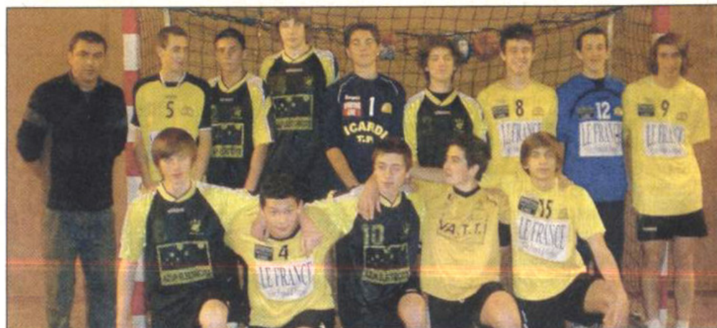
Actuellement en milieu de tableau, les moins de 18 ans espèrent bien se qualifier en championnat de France dès la fin de leur première saison.