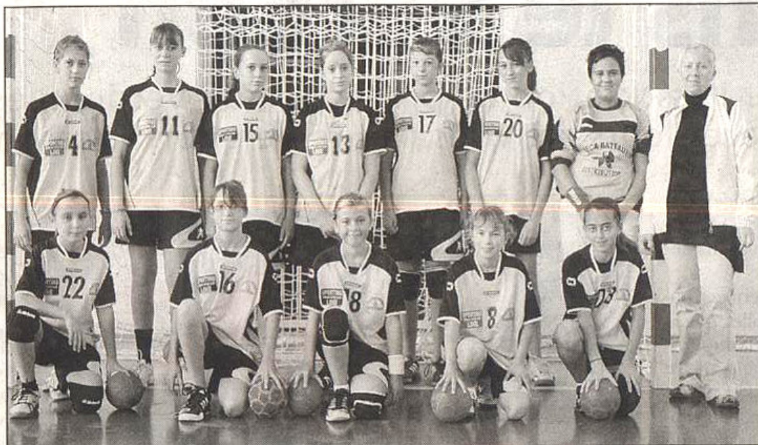
Toutes les équipes du club se sont inclinées ce week-end, à l'exception des moins de 14 ans féminines, victorieuses contre Val d'Argens.

Et la réserve de la prestigieuse équipe de première division n'est pas venue les mains vides à l'Estagnol. Le coach raphaëlois a aligné pas moins de quatre joueurs de l'équipe de France des moins de 21 ans et trois joueurs de l'équipe pro. Mais les Craurois, loin d'être impressionnés ont abordé