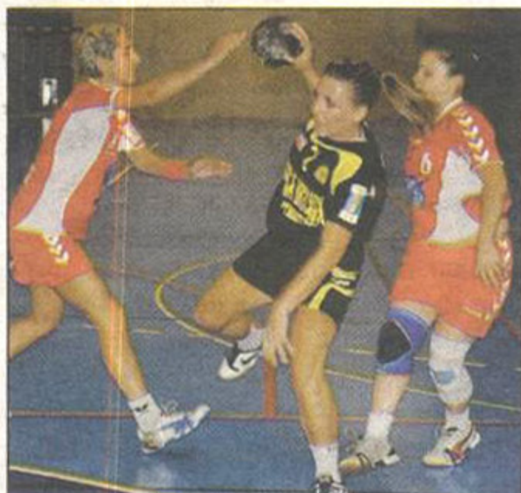
Les Crauroises devront rester sur leurs gardes face à Annecy-Le-Vieux.

L'équipe de Nationale 3 masculine sera quant à elle en déplacement chez son voisin de La Valette-La Garde pour un derby qui s'annonce disputé.