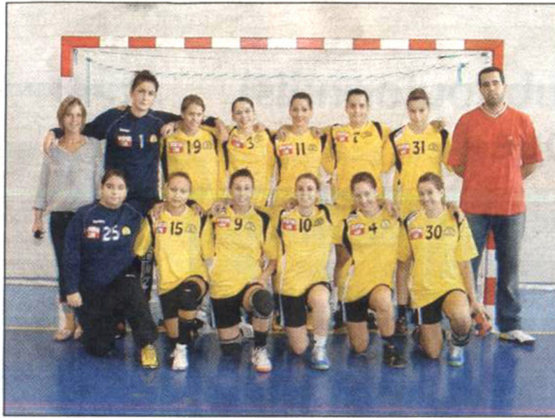
Les Moins de 18 ans filles en route vers les phases finales.

En 2008-2009, les Crauroises avaient terminé troisièmes de leur poule et accroché une belle seconde place au challenge national. L'objectif d'accéder au championnat de France cette année est à portée de main. A quatre rencontres de la fin du championnat, les « jaune et noir » n'ont