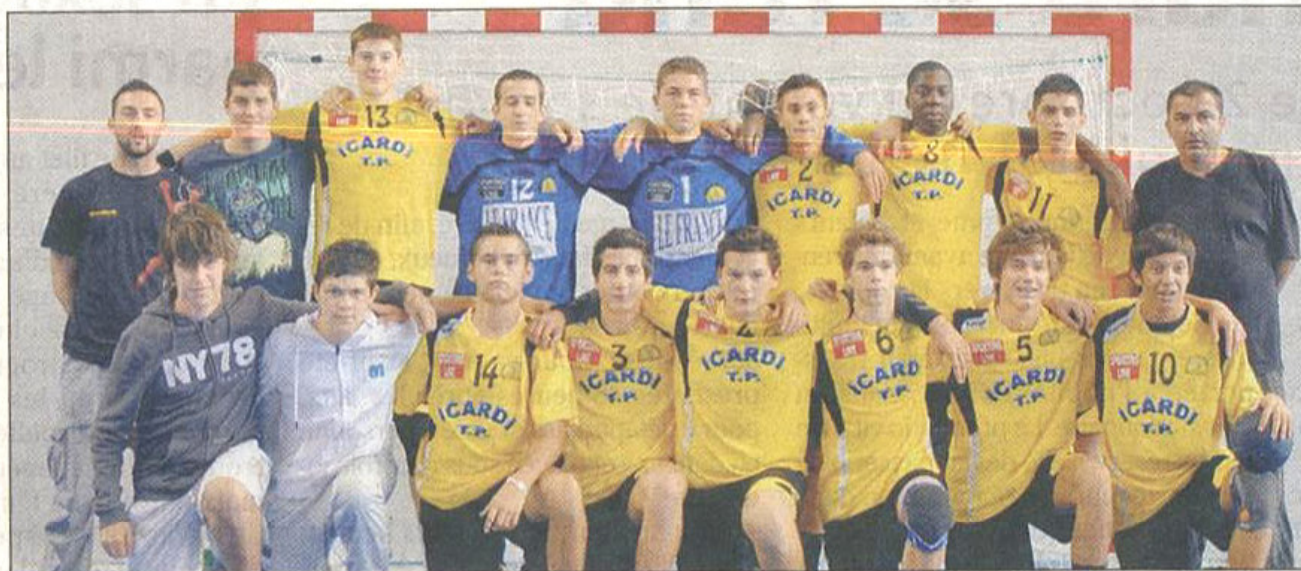
Les moins de 18 ans garçons ont décroché un succès (34-30) contre La Valette.

Il a fallu attendre la fin de match pour voir les combattifs « jaune et noir » s'assurer la victoire. Ce succès (31 - 29) permet aux Craurois d'occuper la