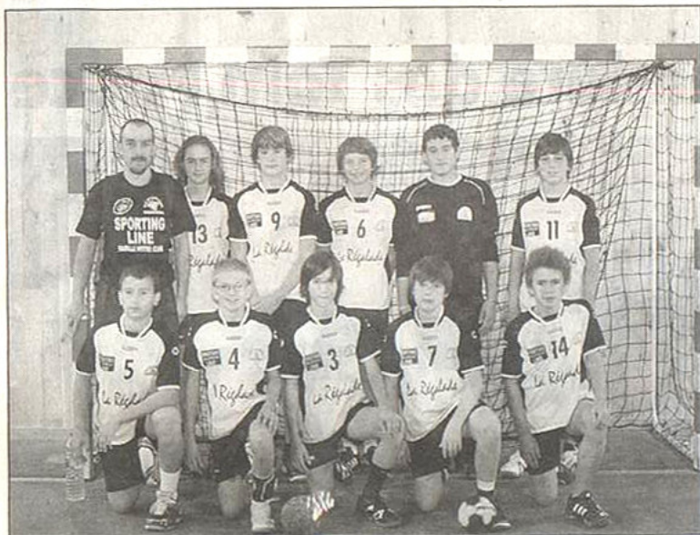
Les moins de 14 ans craurois l'ont emporté ce samedi sur l'équipe du Beausset 34 à 20.

Pré-Nationale féminine : La Crau s'incline 21 à 31 face au Val d'Argens.