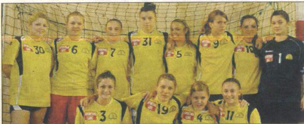
Les moins de 18 ans filles entament leur saison contre Saint-Maximin demain.

Catégorie à l'honneur la saison passée avec une place en quart de finale du championnat de France, les moins de 18 ans filles disposent, cette année encore, d'un groupe très compétitif. Avec pas moins de seize joueuses, les coaches Bertrand Jaget et Adrian Katalinski pourront s'appuyer sur un collectif solide bénéficiant d'une expérience du haut niveau. Trois ancien-