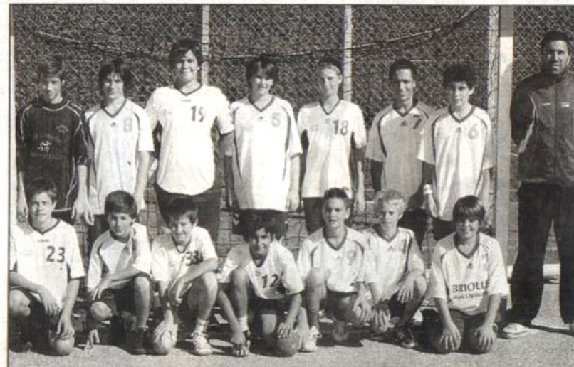
Les Hyérois, eux, ont fini onzièmes.