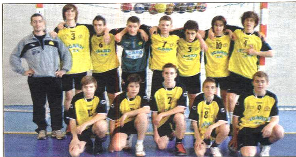
Les moins de 16 ans visent les trois premières places.

Le groupe d'Adrian Katalinski a parfaitement abordé son dernier déplacement de la saison contre l'équipe de Grasse-Mouans-Sartoux en remportant le match 24 à 19. Les Crauroises remontent à la seconde place, synonyme de qualification pour les phases finales du championnat de France. A une journée de la fin, il ne restera plus qu'à assurer lors de l'ultime rencontre