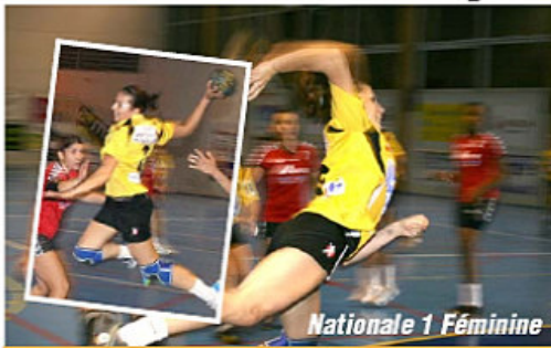
Nationale 1 Féminine