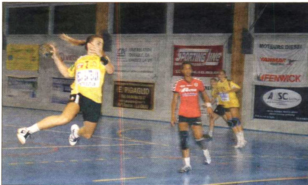
Match de gala pour l'équipe de Nationale 1 Féminine.

Du côté de la prénationale, la rencontre s'annonce disputée pour les filles de Tiziana Marino.