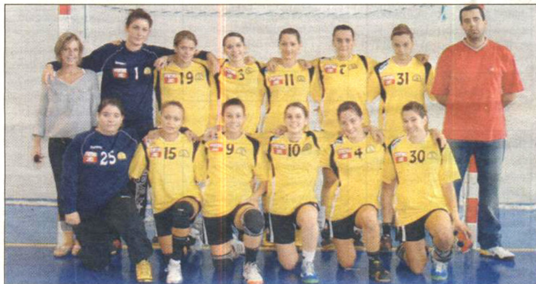
Les - de 18 ans filles sont sur la bonne voie.

L'enjeu était des plus importants pour des Crauroises en quête d'une place qualificative pour les huitièmes de finale du championnat de France (les deux premières équipes de chaque