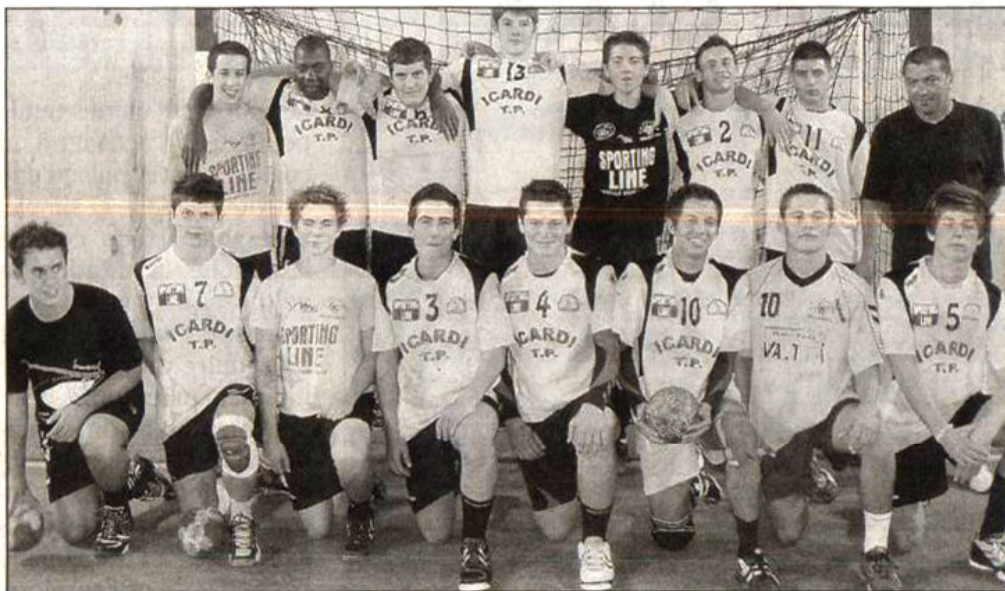
Les moins de 18 ans ont effectué un excellent début de saison avec un bilan de trois victoires et un match nul.

A 20 h 45, ce sera aux féminines de Nationale 2 d'en-