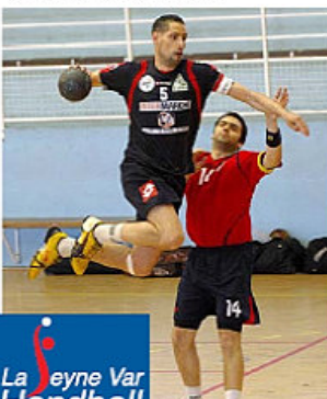
La Seyne Var Handball