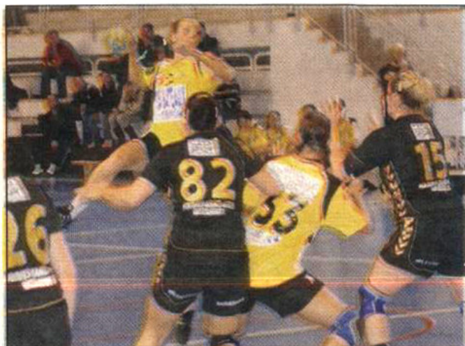
L'attaque crauroise, un point à travailler pour la suite du championnat.

L'US La Crau alterne, depuis le début de la saison, performances à l'extérieur et contre-performances à domicile. Avec quatre victoires (dont trois à l'extérieur) pour six défaites, l'équipe est actuellement 8 e de nationale 1 féminine. Dans un championnat serré, où le 5 e n'est qu'à quatre points et le premier reléguable (mais avec un match d'avance) à trois, tout est encore possible. « Les joueuses ont montré qu'elles étaient capables de gagner n'importe où à l'extérieur, explique l'en-